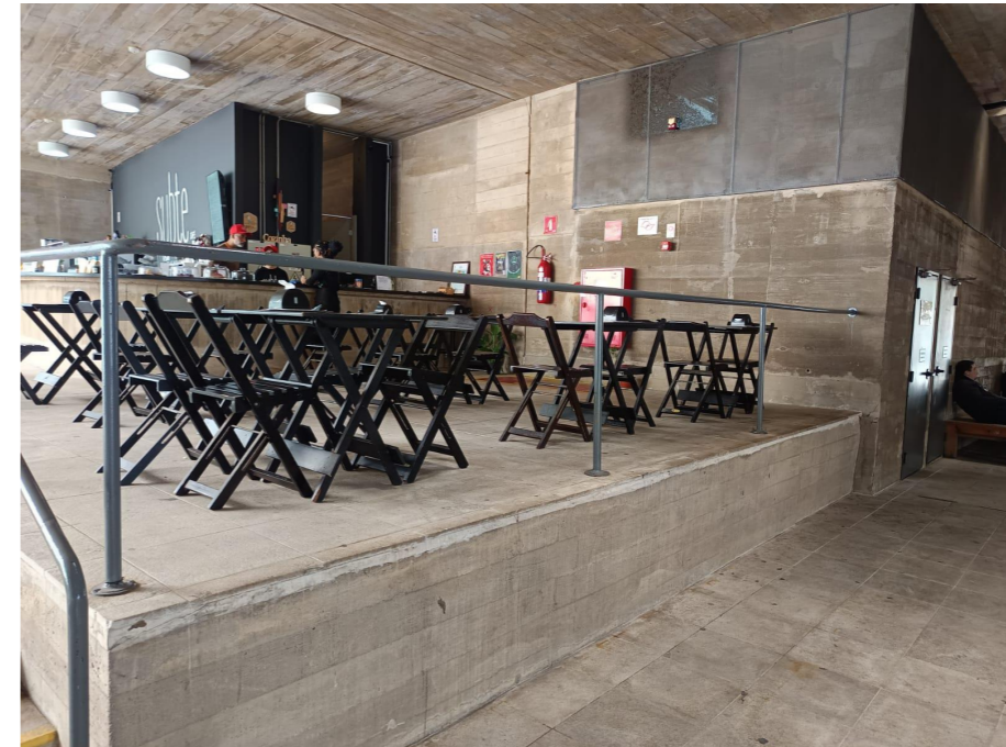
IMAGEM 01 - GUARDA CORPO REFERÊNCIA (RESTAURANTE SUBTE)