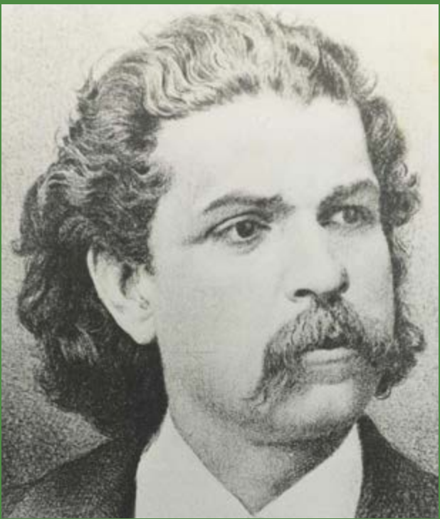
Antônio Carlos Gomes (1836–1896) composição

Nascido em Campinas (SP), o compositor brasileiro Carlos Gomes estudou no Conservatório do Rio de Janeiro e, depois, no de Milão com apoio de Dom Pedro II. Sua ópera mais célebre, O Guarani , estreou em 1870 no Teatro alla Scala, em Milão. É lembrado como o maior operista romântico do Brasil e pioneiro no cenário internacional.