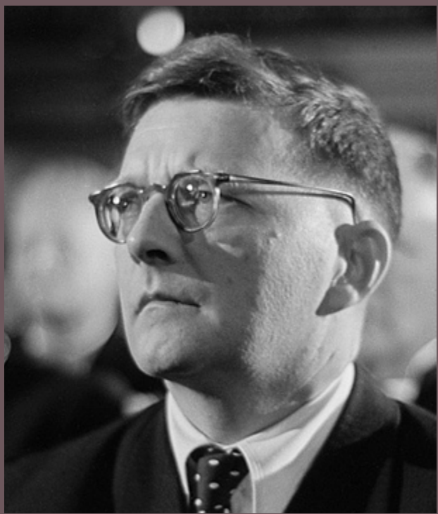
Dmitri Shostakovich (1906–1975) composição

Um dos principais nomes da música do século XX, o compositor russo Dmitri Shostakovich teve uma trajetória célebre e turbulenta, tendo sido ao mesmo tempo combatido e homenageado pelo regime soviético, deixando uma obra vasta e rica. Seu estilo evoluiu do humor ousado e do caráter experimental de seu primeiro período, com influências de Prokofiev e Stravinsky (das óperas O Nariz e Lady Macbeth , por exemplo), ao fervor nacionalista e à melancolia de sua segunda fase (das sinfonias nº 5 e nº 7 ). Já a última fase é marcada pelo clima desafiador e sombrio de obras como a Sinfonia nº 14 e o Quarteto nº 15 . Também compôs balés, dezenas de suítes, diversas obras orquestrais e de câmara, além de ter tido uma produção vocal.