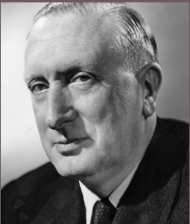
William Walton (1902–1983) composição

Compositor inglês de destaque, William Walton foi considerado um dos principais nomes entre as gerações de Vaughan Williams e Benjamin Britten, reconhecido pela música orquestral, trilhas para cinema e obras vocais. Autodidata, conviveu com os irmãos Sitwell e compôs peças como Façade , Concerto para Viola , A Festa de Belsazar e as óperas Troilo e Créssida e O Urso . Foi influenciado por Elgar, Stravinsky e Hindemith. Em 1951, recebeu o título de cavaleiro.