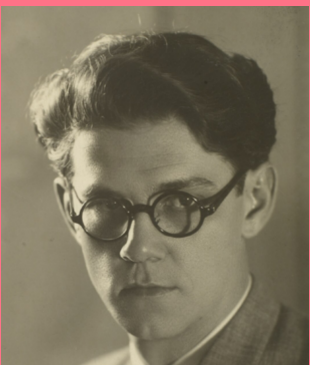
Radamés Gnattali (1906 -1988) composição

Foi compositor, arranjador, maestro, pianista e violinista. Com vasta produção autoral, que abrange o popular e o erudito, contribui, com sua longa trajetória na rádio e na TV, para a difusão da música brasileira, além de criar novos arranjos para ritmos tradicionais.