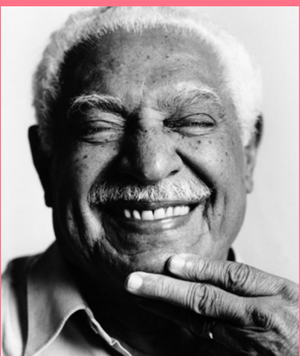
Dorival Caymmi (1914-2008) composição

Dorival Caymmi foi um cantor e compositor brasileiro. Suas letras e melodias retratam o mar, os pescadores, o dia a dia do povo, a graça das mulheres e a divindade dos orixás, constituindo um canto de profundo amor à Bahia. Entre suas canções de sucesso estão Samba da Minha Terra , Marina , Samba da Bahia , O Dengo que a Nega Tem e Saudade de Itapoã .