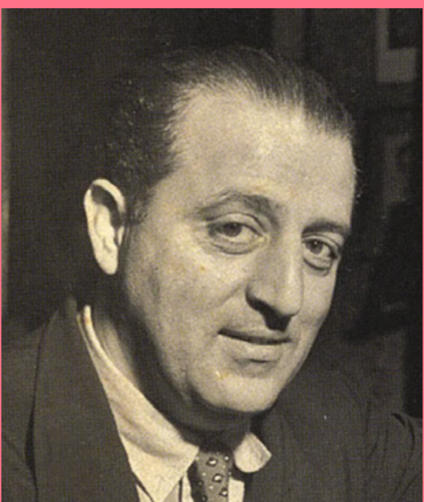
Francisco Mignone (1897-1986) composição