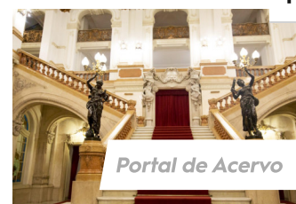
Portal de Acervo