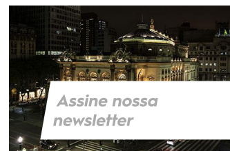
Assine nossa newsletter