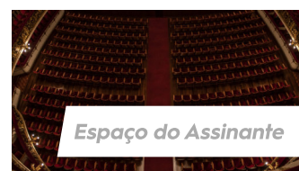
Espaço do Assinante