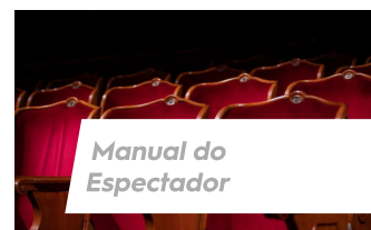
Manual do Espectador