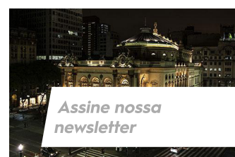
Assine nossa newsletter