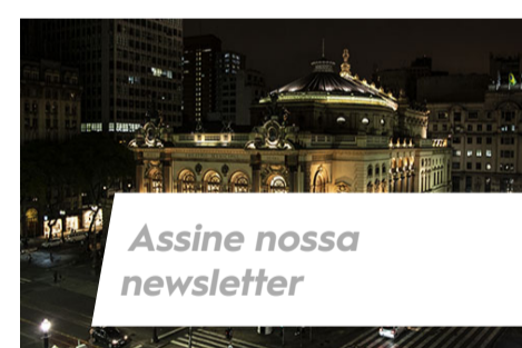
Assine nossa newsletter