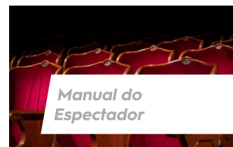
Manual do Espectador