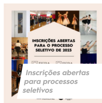
Inscrições abertas para processos seletivos