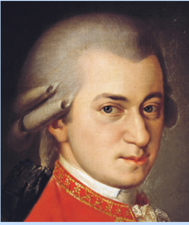
WOLFGANG AMADEUS MOZART (1756-1791) composição

Wolfgang Amadeus Mozart foi um talento precoce. Aos 5 anos já tocava cravo e piano, compunha pequenas peças e, ainda criança, escreveu sua primeira ópera. É considerado um dos mais importantes, e mais profícuos, compositores do classicismo – escreveu mais de 600 obras nos 35 anos em que viveu. Seu legado engloba obras aclamadas, entre elas, Idomeneo (1781), O Rapto no Serralho (1782), As Bodas de Fígaro (1786), Così Fan Tutte (1790) e A Flauta Mágica (1791). Mozart compôs ainda 27 concertos para piano e 26 quartetos para cordas. Sua serenata Eine Kleine Nachtmusik é uma das melodias mais tocadas de todos os tempos.