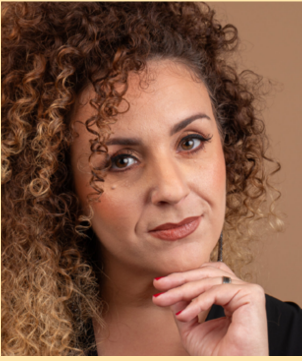
LUDMILLA BAUERFELDT Magna Peccatrix

Detentora de vários prêmios nacionais e internacionais de canto, entre eles o Grand Prix Maria Callas, em Atenas, e o Vozes do Brasil – Theatro Municipal do Rio de Janeiro, a carioca Ludmilla Bauerfeldt formou-se na prestigiosa Accademia do Teatro Alla Scala (Milão, Itália), onde protagonizou as produções Don Pasquale (Donizetti) e La Scala di Seta (Rossini). Desenvolveu carreira como soprano solista em concertos e festivais na Itália (Regio di Parma, Teatro Filarmonico), Suíça (Operaviva), Rússia (Svetlanov Hall, Musical Olympus) e Alemanha (Bad Kissingen, Dresdner Musikfestspiele, Stars and Rising Stars), entre outros. Presença frequente nas principais casas de ópera do país, alguns de seus últimos trabalhos incluem a estreia brasileira de Orphée (Phillip Glass) no papel de Eurydice; Donna Anna em Don Giovanni (Mozart); Suor Angelica em Il Trittico (Puccini), e na aclamada nova produção de La Traviata (Verdi) estreia Violetta Valery, no Theatro Municipal do Rio de Janeiro; a première mundial de Translieder (Flô Menezes) e a 8ª Sinfonia de G. Mahler, ambos com a Orquestra Sinfônica do Estado de São Paulo (Osesp), além da montagem de O Rapto do Serralho (Mozart), em que interpreta Konstanze, no Theatro São Pedro, em São Paulo. Compromissos de 2025 incluíram seu debut no Theatro Municipal de São Paulo como Donna Anna, em Don Giovanni (Mozart), e como Violetta, em La Traviata (Verdi), em Porto Alegre.