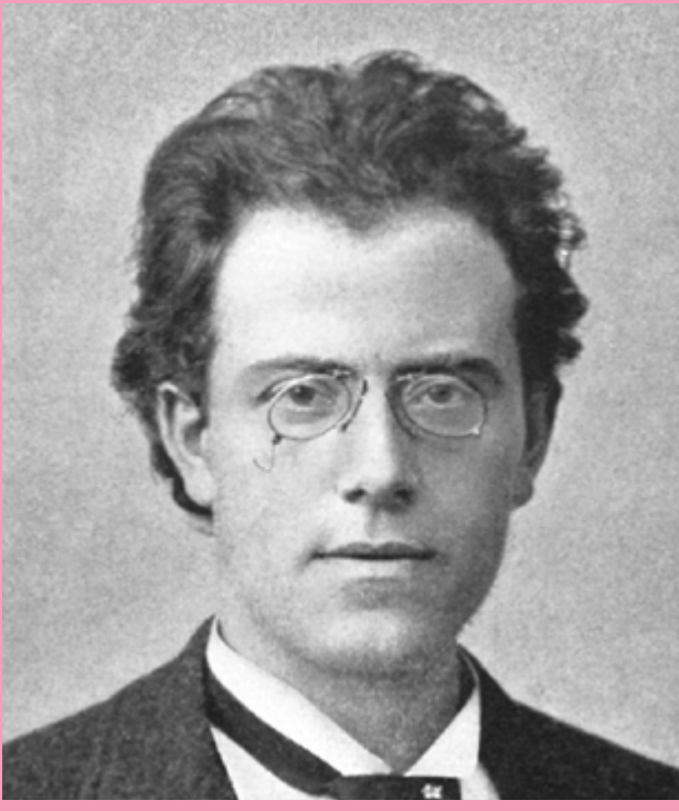
GUSTAV MAHLER (1860-1911) composição

Regente, compositor e orquestrador, Gustav Mahler foi um dos maiores nomes do período romântico. Porta-voz das transformações musicais na virada do século XX, foi atuante na transição entre o Romantismo e o Modernismo. Aos 15 anos, em 1875, ingressou no Conservatório de Viena. Em 1885, regeu na famosa Ópera de Praga, o que tornou seu nome mais conhecido. Já em 1892, regeu na Royal Opera House de Londres. Em 1897, alcançou o cargo musical mais cobiçado de toda a Europa: maestro titular da Ópera Imperial de Viena. Entre suas obras mais famosas estão a Sinfonia n° 8 e a Sinfonia n° 2 .