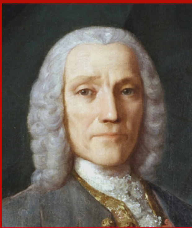
Domenico Scarlatti (1685–1757) composição

Domenico Scarlatti foi um compositor e cravista italiano, filho de Alessandro Scarlatti. Iniciou a carreira em Nápoles e Roma, escrevendo óperas e trabalhando como organista. Em 1719 mudou-se para Portugal e depois para a Espanha, onde passou grande parte de sua vida a serviço da princesa Maria Bárbara. É lembrado principalmente por suas cerca de 555 sonatas para cravo, obras que expandiram de forma inovadora a técnica do teclado e incorporaram fortes influências da música popular ibérica. Sua produção transformou o repertório do instrumento e garantiu seu lugar entre os grandes compositores do período barroco.