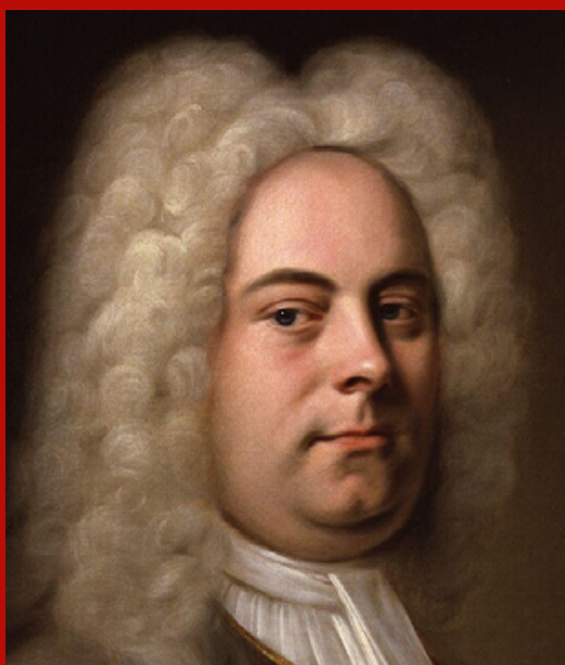
Georg Friedrich Haendel (1685-1759) composição