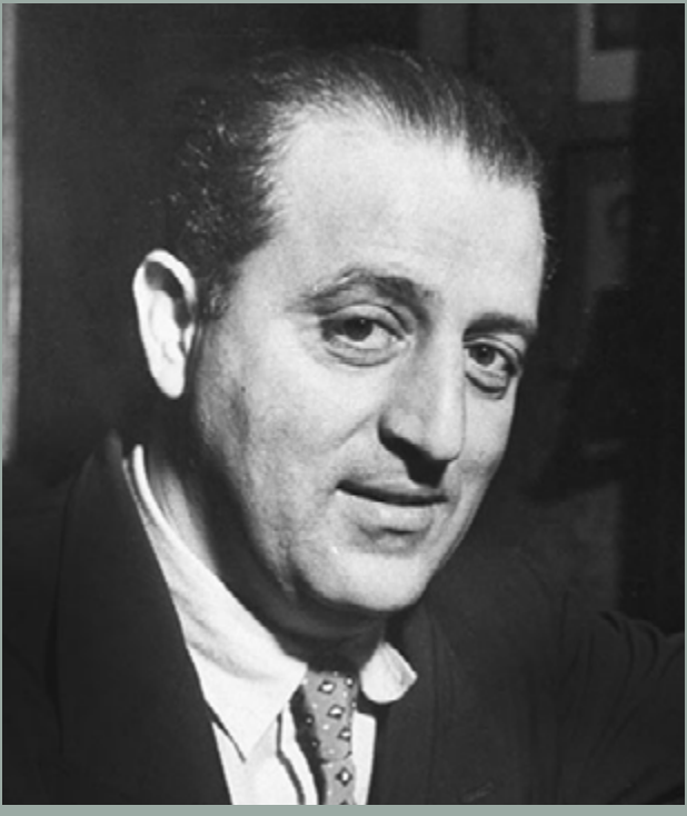
FRANCISCO MIGNONE (1897–1986) composição

Compositor, pianista, regente, professor e flautista, Francisco Mignone era filho do flautista italiano Alferio Mignone, que imigrou para o Brasil em 1896. Fundamental na história da música clássica, Mignone teve generosa participação na música dita popular, assinando com o pseudônimo de Chico Bororó. Foi membro da Academia Brasileira de Música e fundador do Conservatório Brasileiro de Música.