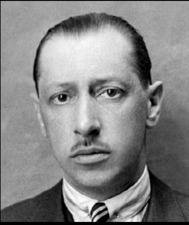
IGOR STRAVINSKY (1882-1971) composição

Igor Stravinsky foi um compositor norte-americano nascido na Rússia. Filho de músico, decidiu ser compositor aos 20 anos e estudou com Nikolai Rimsky-Korsakov. Sua obra Fireworks (1908) foi ouvida pelo empresário Serguei Diaghilev, que o contratou para escrever o balé Firebird (1910), cujo grande sucesso fez dele o principal compositor jovem da Rússia. Logo depois veio o balé Petrushka (1911). Seu balé seguinte, A Sagração da Primavera (1913), foi um marco na história da música e sua estreia em Paris causou um tumulto no teatro, assegurando a notoriedade internacional de Stravinsky. No início da década de 1920, ele adotou um estilo radicalmente diferente de neoclassicismo contido, empregando referências muitas vezes irônicas a músicas mais antigas. Suas principais obras neoclássicas incluem Édipo Rex (1927), Sinfonia dos Salmos (1930) e a ópera The Rake's Progress (1951). A partir de 1954, empregou o serialismo, uma técnica composicional. Seus trabalhos posteriores incluem Agon (1957) e Requiem Canticles (1966).