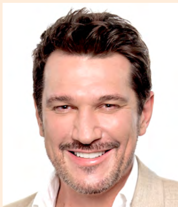
Paulo Szot celebrante

O paulistano Paulo Szot fez sua estreia operística em 1996, aqui no palco do Theatro Municipal de São Paulo, como integrante do Coro Lírico, em Turandot. No ano seguinte, debutou como solista, também em São Paulo, em O Barbeiro de Sevilha interpretando Figaro. Apresentou-se nas principais casas de ópera e salas de concerto no Brasil. Em 2003, fez sua estreia internacional no New York City Opera como Escamillo em Carmen. Em 2004, foi a vez da Europa, na Opéra de Marseille, em que atuou no papel-título em Eugene Onegin, de Tchaikovsky. Participou de dez temporadas no The Metropolitan Opera. Em 2008, recebeu diversas premiações como Tony Awards e Theatre World Awards como Melhor Ator Protagonista em Musical por sua estreia na Broadway em South Pacific e, em 2011, foi indicado ao Laurence Olivier Awards pelo mesmo papel. Apresenta-se com frequência com a New York Philharmonic, Osesp, New York Pops, Chicago Symphony, Filarmônica de Varsóvia, Sinfônica de Barcelona, Philadelphia Orchestra e em salas de concerto do Lincoln Center, Carnegie Hall, Southbank Center (Londres), Ravinia Festival, bem como com inúmeras companhias de ópera, entre elas San Francisco Opera, Washington National Opera, Canadian Opera, Opera Australia (Sydney e Melbourne), Vlaamse Opera, Opéra de Monte-Carlo e Dutch National Opera. Em 2019, foi o artista em residência da Osesp. Atualmente, está em cartaz no musical Hometown, no Walter Kerr Theatre (Broadway), no papel de Hades.