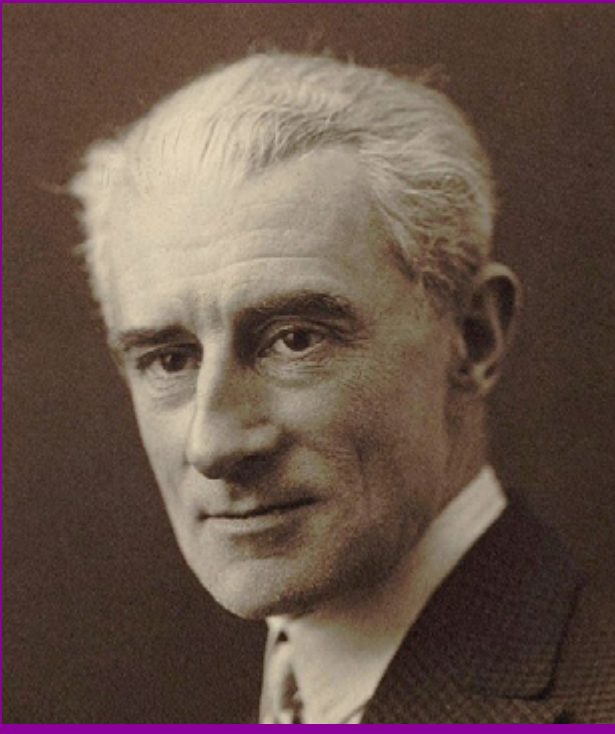
MAURICE RAVEL (1875-1937) composição

O compositor Maurice Ravel nasceu na cidade francesa de Ciboure. Iniciou os estudos de piano aos 7 anos e, aos 14, foi aceito no Conservatório de Paris. Ravel uniu a elegância francesa à música popular espanhola, influência que pode ser vista em Rapsódia Espanhola (1907), na ópera breve A Hora Espanhola (1911) e em sua composição mais conhecida, Bolero (1928). Em 1909, recebeu a encomenda de um balé, a ser estreado pelo Ballet Russes, companhia do empresário Sergei Diaghilev: Daphnis et Chloé . Também um magnífico orquestrador, em 1922 orquestrou a suíte para piano Quadros de uma Exposição , de Modest Mussorgsky. Ao lado de Claude Debussy, é considerado um dos principais representantes do Impressionismo francês.