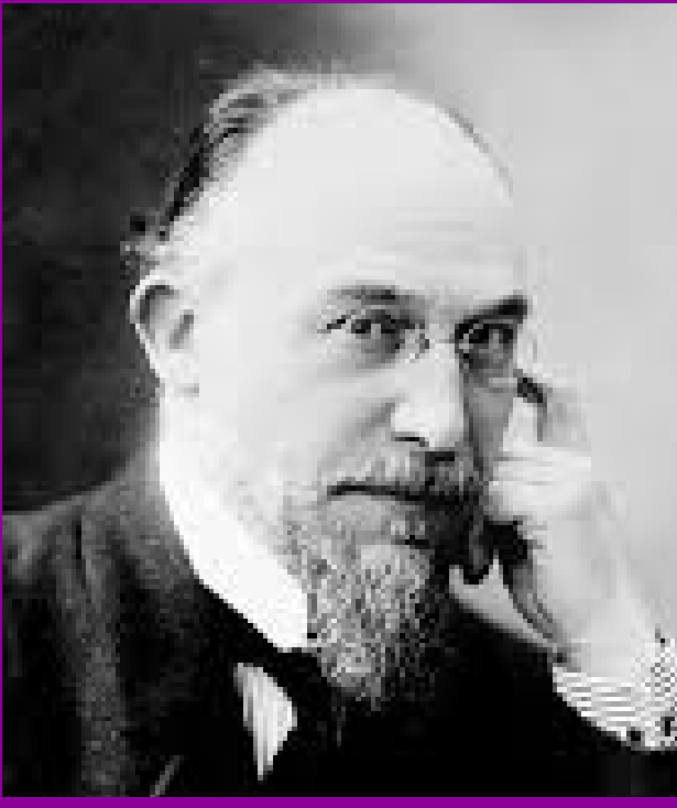
ERIK SATIE (1866-1925) composição

Erik Satie foi um compositor francês cujo estilo econômico, pouco convencional e frequentemente espirituoso exerceu grande influência sobre a música do século XX, especialmente na França. Estudou no Conservatório de Paris, trabalhou depois como pianista de café e, por volta de 1890, aproximou-se do movimento rosacruziano, sob cuja influência compôs obras como Messe des Pauvres . Sua música marcou uma ruptura com o romantismo francês do século XIX, opôs-se à tradição representada por Claude Debussy e se destacou pela recusa do sentimentalismo, das formas tradicionais e das estruturas tonais convencionais. Entre suas obras mais conhecidas estão Trois Gymnopédies , Parade , Socrate e Relâche .