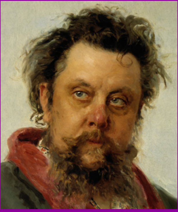
MODEST MUSSORGSKY (1839-1881) composição

Modest Mussorgsky foi um compositor russo, especialmente conhecido pela ópera Boris Godunov , por suas canções e pela peça para piano Quadros de uma Exposição . Foi integrante de The Five, grupo de compositores reunidos em torno do objetivo de criar uma escola nacionalista de música russa. Filho de um proprietário de terras, estudou em São Petersburgo, seguiu inicialmente a carreira militar, depois deixou o exército para dedicar-se à música, e seus últimos anos foram marcados pelo alcoolismo e pela solidão.