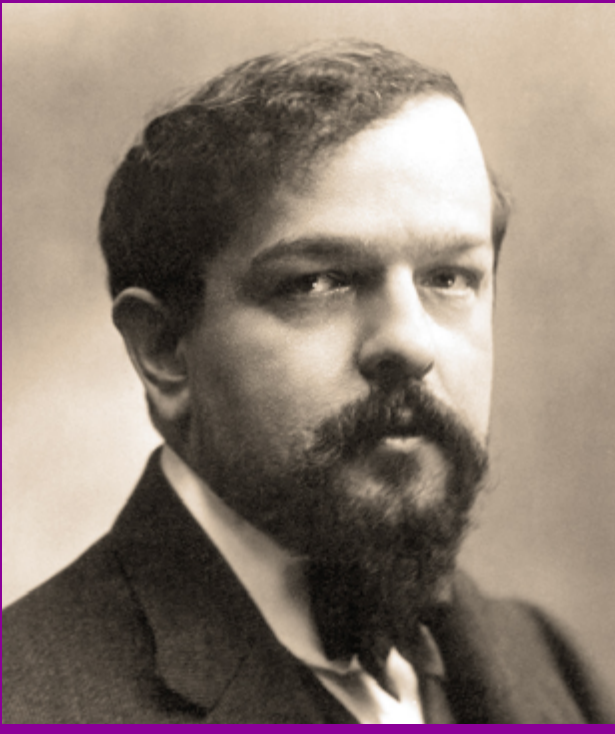
CLAUDE DEBUSSY (1862-1918) composição

O compositor e pianista francês Claude Debussy, referência do século XX, é considerado o grande impressionista da música. Debussy estudou no Conservatório de Paris, em 1873, onde teve como professores grandes nomes da música e recebeu diversos prêmios – obtendo até mesmo uma bolsa de estudos na Itália. O reconhecimento de Debussy como compositor aconteceu principalmente graças a estreia da ópera Pelléas et Mélisande , em 1902, em Paris. Entre suas obras mais marcantes estão Prélude à l'Après-midi d'un Faune , que para alguns marca o início da música moderna, e Jeux , seu último trabalho orquestral.