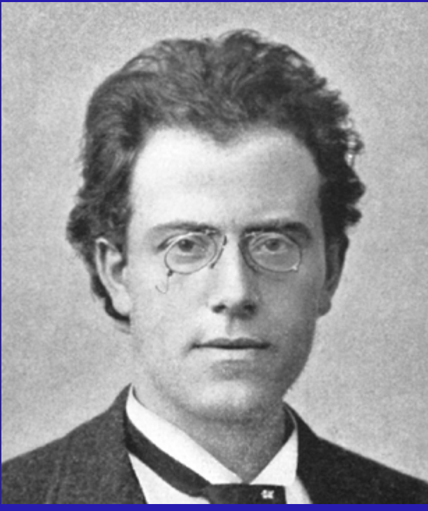
GUSTAV MAHLER (1860-1911) composição

Regente, compositor e orquestrador, Gustav Mahler foi um dos maiores nomes do período romântico. Porta-voz das transformações musicais na virada do século XX, foi atuante na transição entre o Romantismo e o Modernismo. Aos 15 anos, em 1875, ingressou no Conservatório de Viena. Em 1885, regeu na famosa Ópera de Praga, o que tornou seu nome mais conhecido. Já em 1892, regeu na Royal Opera House de Londres. Em 1897, alcançou o cargo musical mais cobiçado de toda a Europa: maestro titular da Ópera Imperial de Viena. Entre suas obras mais famosas estão a Sinfonia nº 8 e a Sinfonia nº 2 .