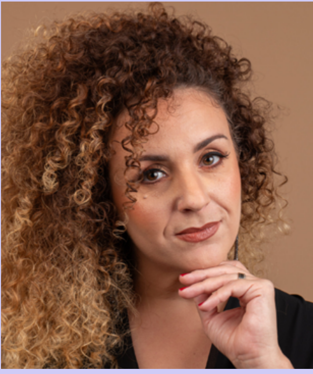
LUDMILLA BAUERFELDT soprano

Detentora de vários prêmios nacionais e internacionais de canto, entre eles o Grand Prix Maria Callas, em Atenas, e o Vozes do Brasil – Theatro Municipal do Rio de Janeiro, a carioca Ludmilla Bauerfeldt formou-se na prestigiosa Accademia do Teatro Alla Scala (Milão, Itália) onde protagonizou as produções Don Pasquale (Donizetti) e La Scala di Seta (Rossini). Desenvolveu carreira como soprano solista em concertos e festivais na Itália (Regio di Parma, Teatro Filarmonico), Suíça (Operaviva), Rússia (Svetlanov Hall, Musical Olympus) e Alemanha (Bad Kissingen, Dresdner Musikfestspiele, Stars and Rising Stars), entre outros. Presença frequente nas principais casas de ópera do país, alguns de seus últimos trabalhos incluem a estreia brasileira de Orphée (Phillip Glass) no papel de Eurydice; Donna Anna em Don Giovanni (Mozart); Suor Angelica no Il Trittico (Puccini), e na aclamada produção de La Traviata (Verdi), estreia Violetta Valery, no Theatro Municipal do Rio de Janeiro. Outros trabalhos incluem a première mundial de Translieder (Flô Menezes) e a 8ª Sinfonia de G. Mahler, ambos com a Orquestra Sinfônica do Estado de São Paulo, além da montagem de O Rapto do Serralho (Mozart), em que deu vida a Konstanze, no Theatro São Pedro, em São Paulo. Compromissos para 2025 incluíram seu debut no Theatro Municipal de São Paulo como Donna Anna, em Don Giovanni (Mozart), e como Violetta em La Traviata (Verdi), em Porto Alegre.