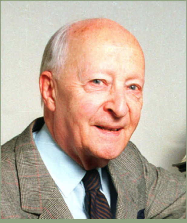
WITOLD LUTOSŁAWSKI (1913-1994) composição

Witold Lutosławski foi um dos principais compositores poloneses do século XX. Em sua obra, combinou elementos do folclore, serialismo, contraponto atonal e improvisação controlada, sem abandonar totalmente a melodia e a harmonia tradicionais. Formou-se em piano e composição em Varsóvia. Durante a ocupação nazista, participou de concertos clandestinos e, no pós-guerra, teve obras classificadas como “formalistas” pelo regime comunista. Entre suas composições mais conhecidas estão Concerto para Orquestra , Funeral Music , Venetian Games e Concerto para Violoncelo e Orquestra .