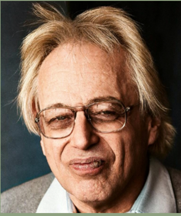
GYÖRGY LIGETI (1923-2006) composição

György Ligeti é conhecido como um dos mais importantes compositores de vanguarda da segunda metade do século XX e um dos mais inovadores e influentes entre as figuras progressistas de seu tempo. Seus primeiros trabalhos mostram a influência de Béla Bartók e Zoltán Kodály e, como eles, Ligeti estudou música folclórica e fez transcrições de material folclórico. Com o tempo, desenvolveu um novo estilo caracterizado por uma densa polifonia e formas estáticas. O seu estilo polifônico tornou-se mais transparente e melódico nas obras dos anos 1970 e, a partir da década de 1980, desenvolveu uma técnica polirrítmica complexa. A sua fama foi intensificada pela utilização de suas composições nos filmes de Stanley Kubrick 2001: Uma Odisseia no Espaço , O Iluminado e De Olhos Bem Fechados .