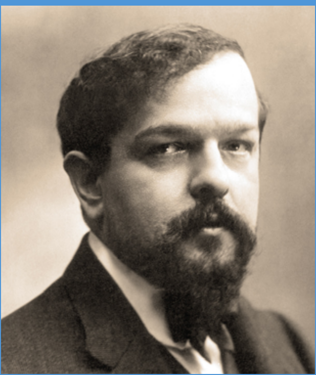
Claude Debussy (1862–1918) composição

O compositor e pianista francês Claude Debussy, referência do século XX, é considerado o grande impressionista da música. Estudou no Conservatório de Paris, em 1873, onde teve como professores grandes nomes da música e recebeu diversos prêmios – obtendo até mesmo uma bolsa de estudos na Itália. O reconhecimento de Debussy como compositor aconteceu principalmente graças à estreia da ópera Pelléas et Mélisande , em 1902, em Paris. Entre suas obras mais marcantes estão Prélude à l'Après-midi d'un Faune , que para alguns marca o início da música moderna, e Jeux , seu último trabalho orquestral.